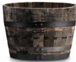
CARVALHO USADO USED OAK

ACESSÓRIOS OPCIONAIS OPTIONAL ACCESSORIES