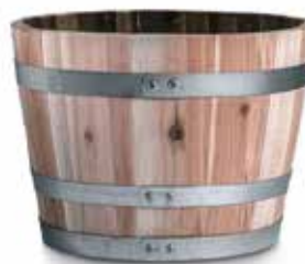
AUSTRÁLIA • ACÁCIA