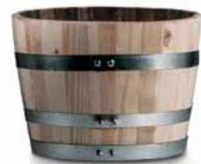
PINHO • PINE