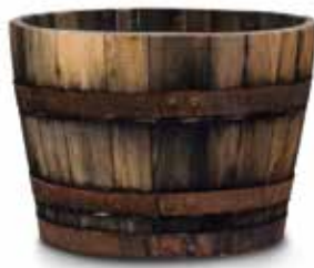
CASTANHO ESCURECIDO CHESTNUT OLD LOOK