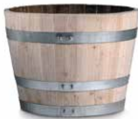
CASTANHO • CHESTNUT