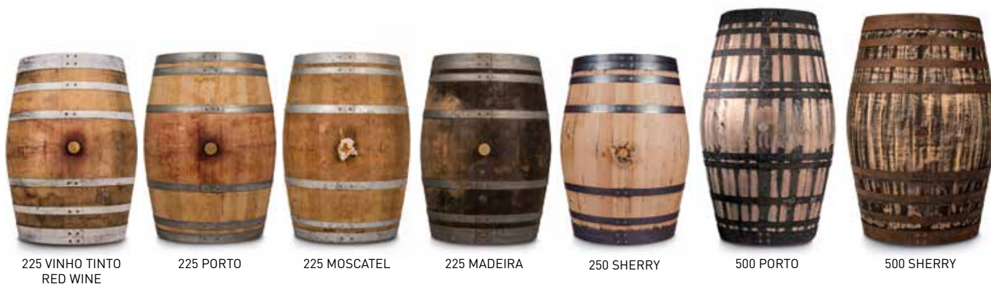
225 VINHO TINTO RED WINE